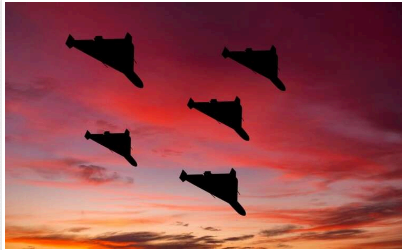
У ЦПД уточнили причину скорочення кількості російських атак із використанням «шахедів»

Росіяни почали менше атакувати «шахедами» після успішних ударів ЗСУ по місцях виробництва та зберігання компонентів для БПЛА. Проте вони накопичили ракети різних типів, зокрема Х-101, «калібри» та балістичні ракети.