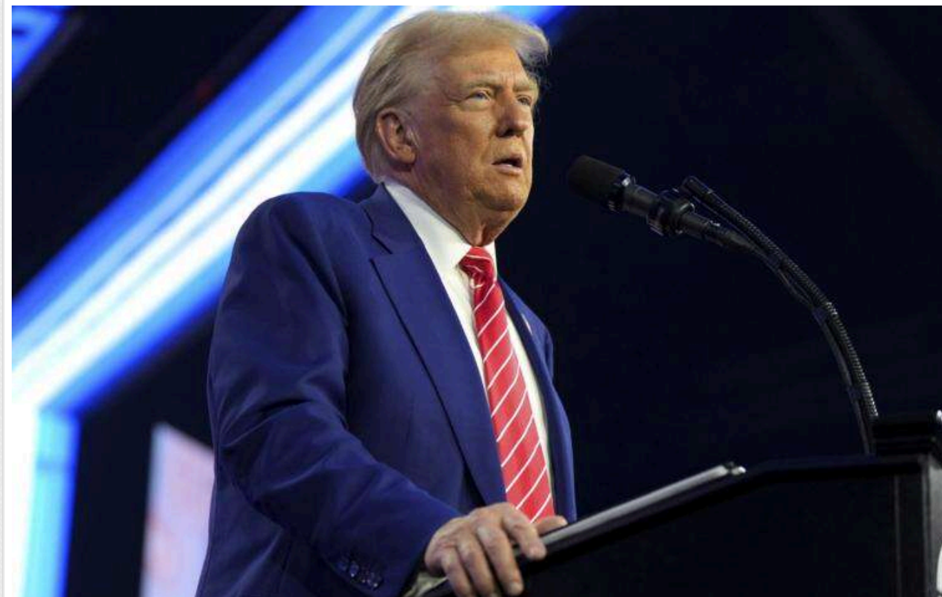
Трамп "зменшив гучність риторики" стосовно своїх великих обіцянок, – The Hill

Новообраний президент США Дональд Трамп, здається, почав пом'якшувати свою риторикку щодо амбітних передвиборчих обіцянок. Під час виборчої кампанії політик обіцяв швидко завершити війну в Україні, знизити ціни та використовувати тарифи для підтримки економіки та виробництва. Однак тепер майбутній очільник Білого дому визнає, що виконати все це не так просто.