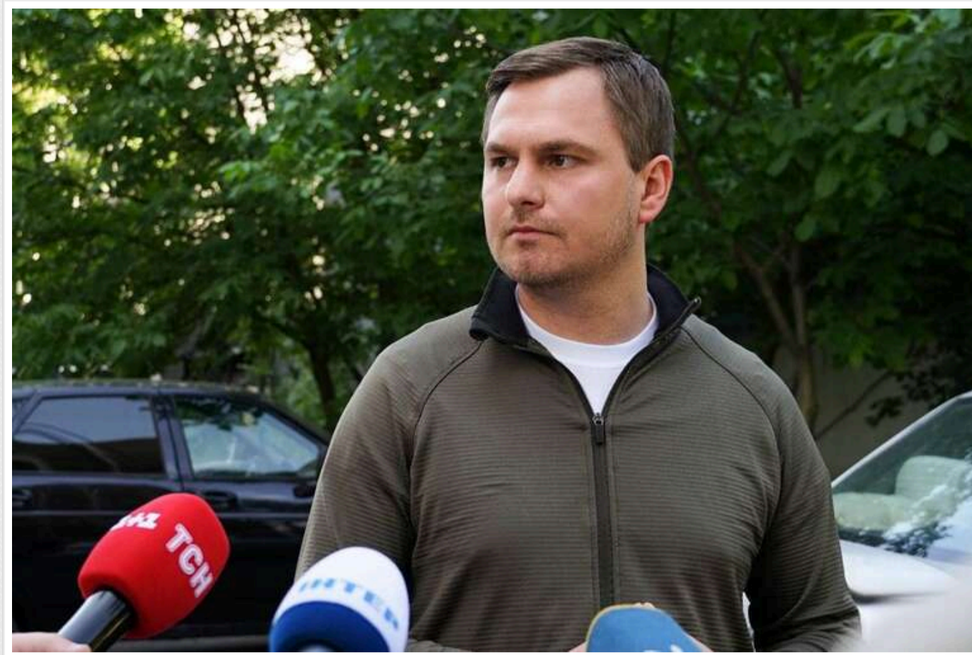
Зеленський може призначити голову Київської ОВА Кравченка на посаду генпрокурора, - ЗМІ

За інформацією джерел АНТИКОРУ, найближчими днями президент України Володимир Зеленський може призначити Руслана Кравченка, голову Київської обласної військової адміністрації, на посаду генерального прокурора.