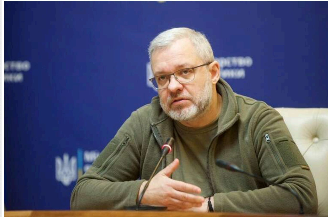
Через погрози Фіцо Україна звернулась до енергетичного єврокомісара

Україна звернулася до єврокомісара з питань енергетики через загрози від прем'єра Словаччини Роберта Фіцо. Українська сторона вважає, що всі країни ЄС повинні дотримуватись чинних норм.