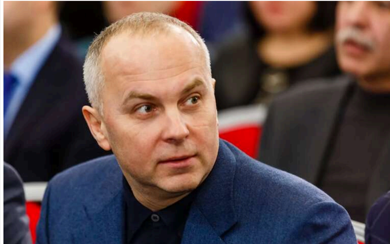
Суд зобов'язав доставляти нардепа Шуфрича із СІЗО на засідання Ради: Дубинський також пообіцяв повернутися