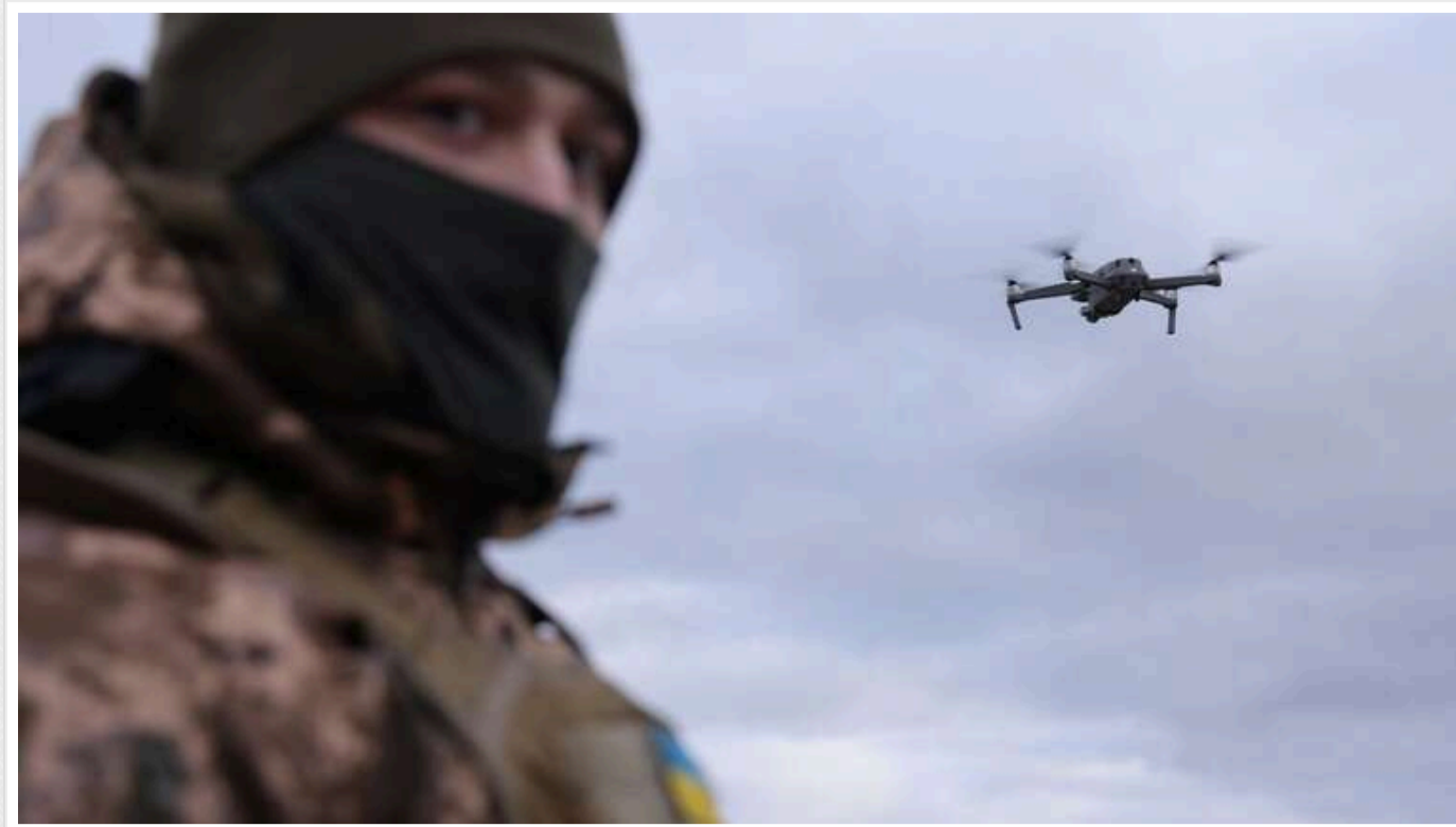
На Лиманському напрямку дрон-камікадзе бійців 60 ОМБр атакував російського загарбника у спину

Українські воїни з підрозділу ББнС "Vidarr" 60-ї окремої механізованої бригади на Лиманському напрямку знищили групу російських піхотинців за допомогою дронів-камікадзе. Окупантам не вдалося сховатися чи втекти від безпілотників.