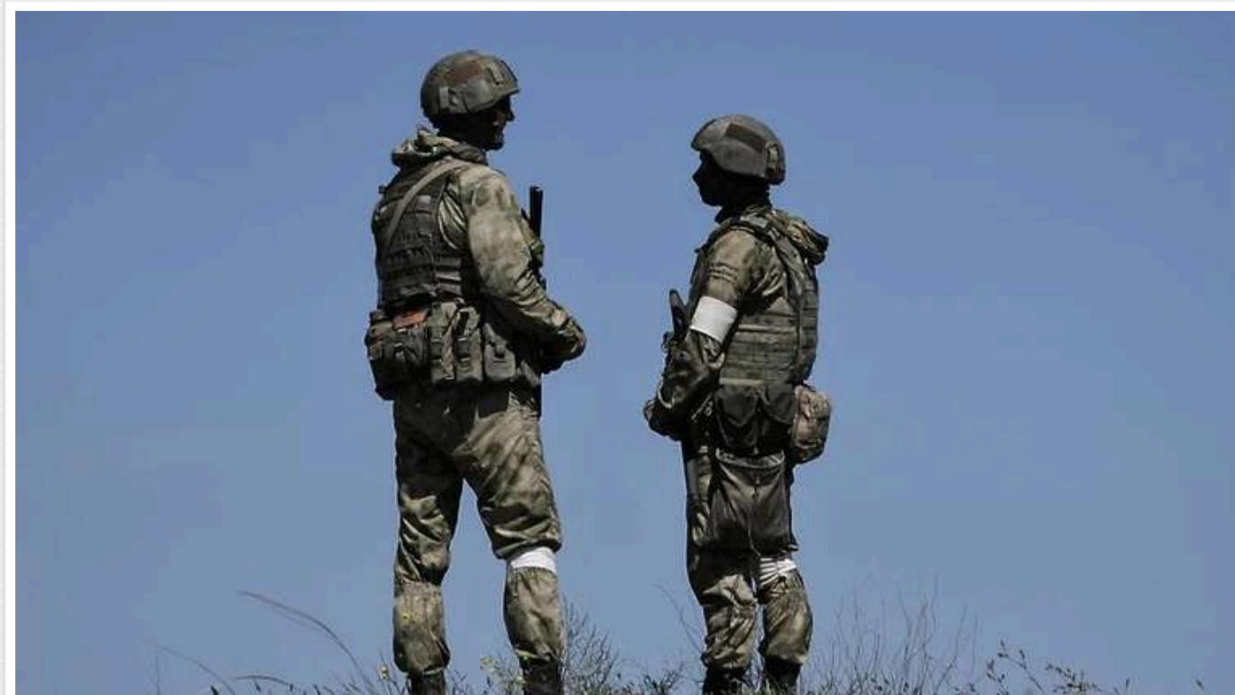
ЦНС: Російські військові на окупованій Херсонщині втікають із фронту все частіше

На тимчасово захоплених територіях Херсонської області спостерігається збільшення випадків дезертирства серед російських військових. Для запобігання цьому командування застосовує загороджувальні загоони.