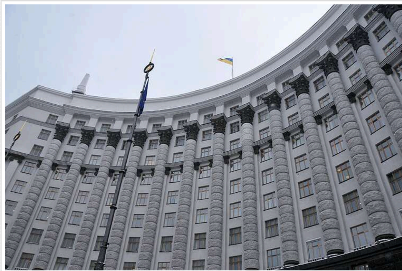
В Кабміні погодили звільнення двох голів ОВА

Кабмін схвалив звільнення двох голів обласних військових адміністрацій 28 грудня. Зокрема, Київської та Полтавської.