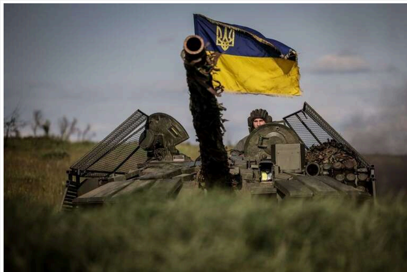
Bloomberg: До весни ЗСУ можуть втратити всю захоплену територію Курської області

Українські війська можуть втратити всю контрольовану територію в Курській області через кілька місяців. Це може позбавити Україну важливих важелів впливу на переговори з Росією про припинення вогню.