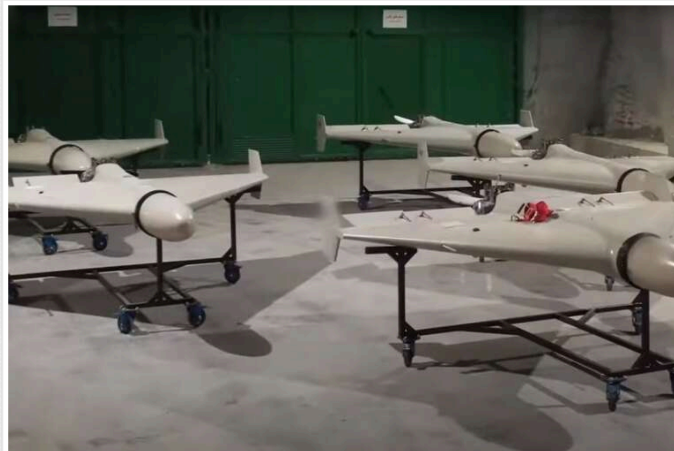
CNN: РФ розширює виробництво «шахедів» на заводі в Татарстані

Росії вдалося значно збільшити виробництво іранських ударних безпілотників типу «шахед» та розвідувальних дронів.