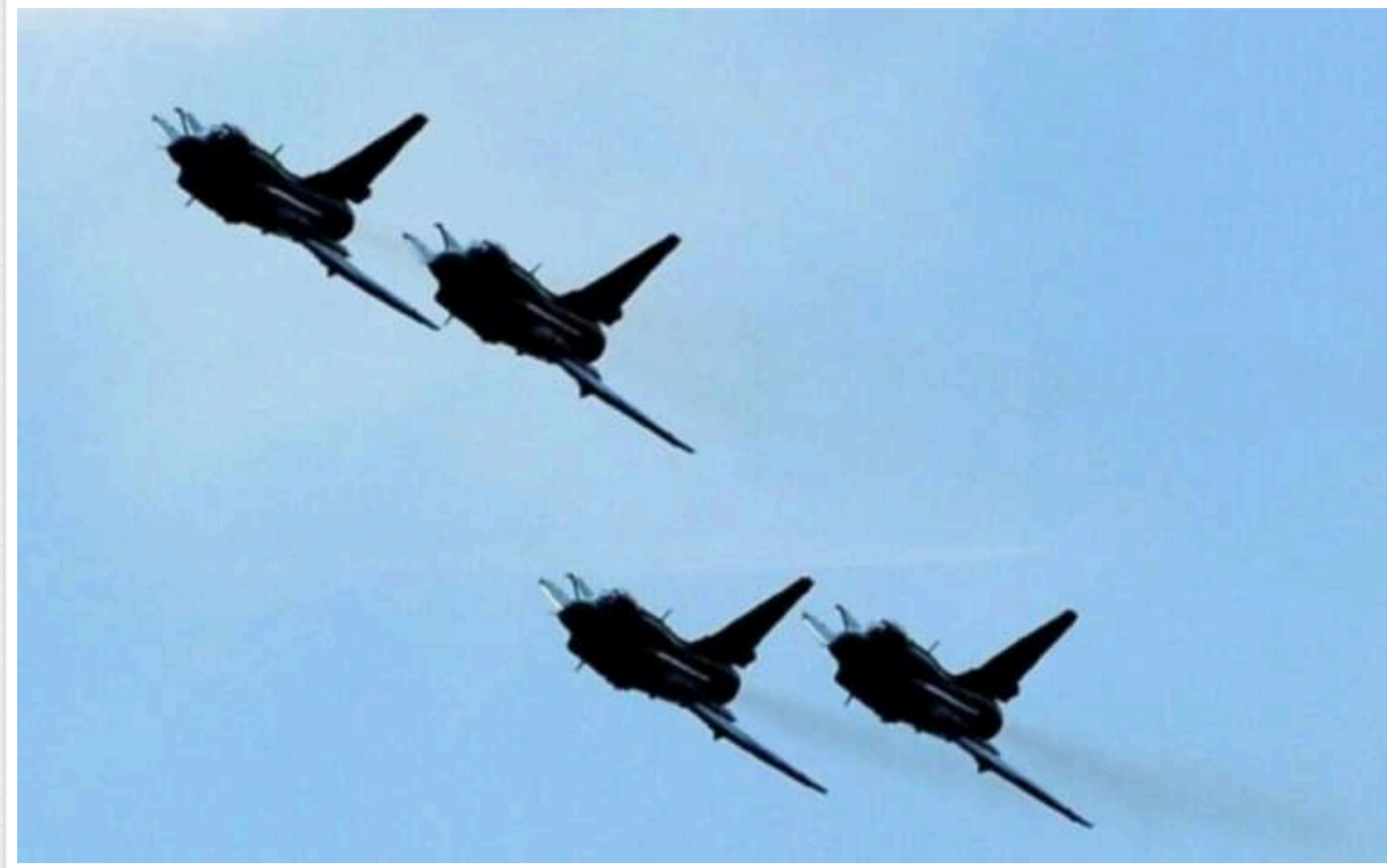
Китай підняв у небо ще один таємничий винищувач

Нещодавно Китай підняв у небо ще один винищувач нового покоління. Літак, який отримав назву J-36, має менші розміри в порівнянні з моделлю JH-XX.