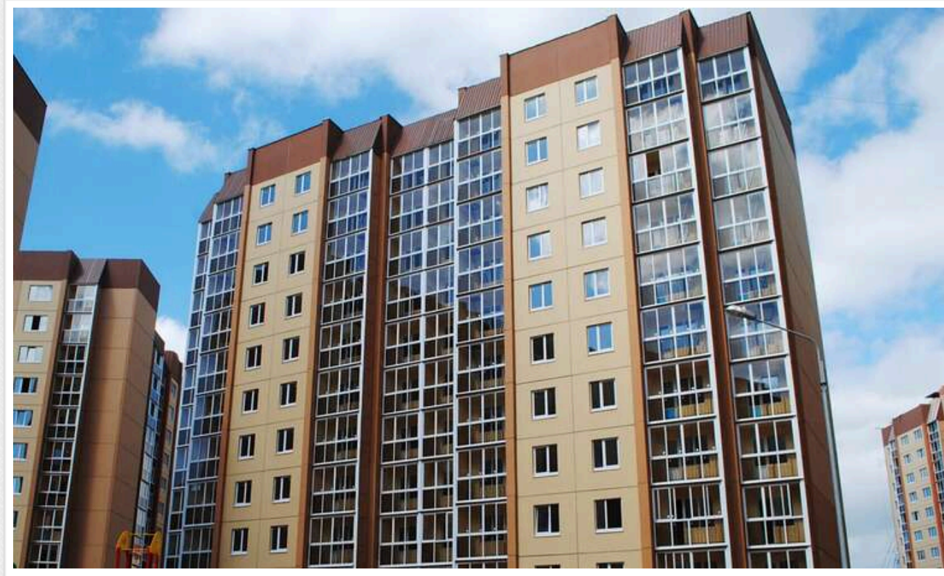
Судді та поліцейські масово приватизують службове житло і приховують власне: потім продають і знову встають у чергу

Схема приватизації службового житла в Україні надзвичайно проста. Посадовці спочатку приховують у декларації своє реальне житло, через що отримують службове, а потім просто викуповують його. Приватизація службового житла у такий спосіб є законною.