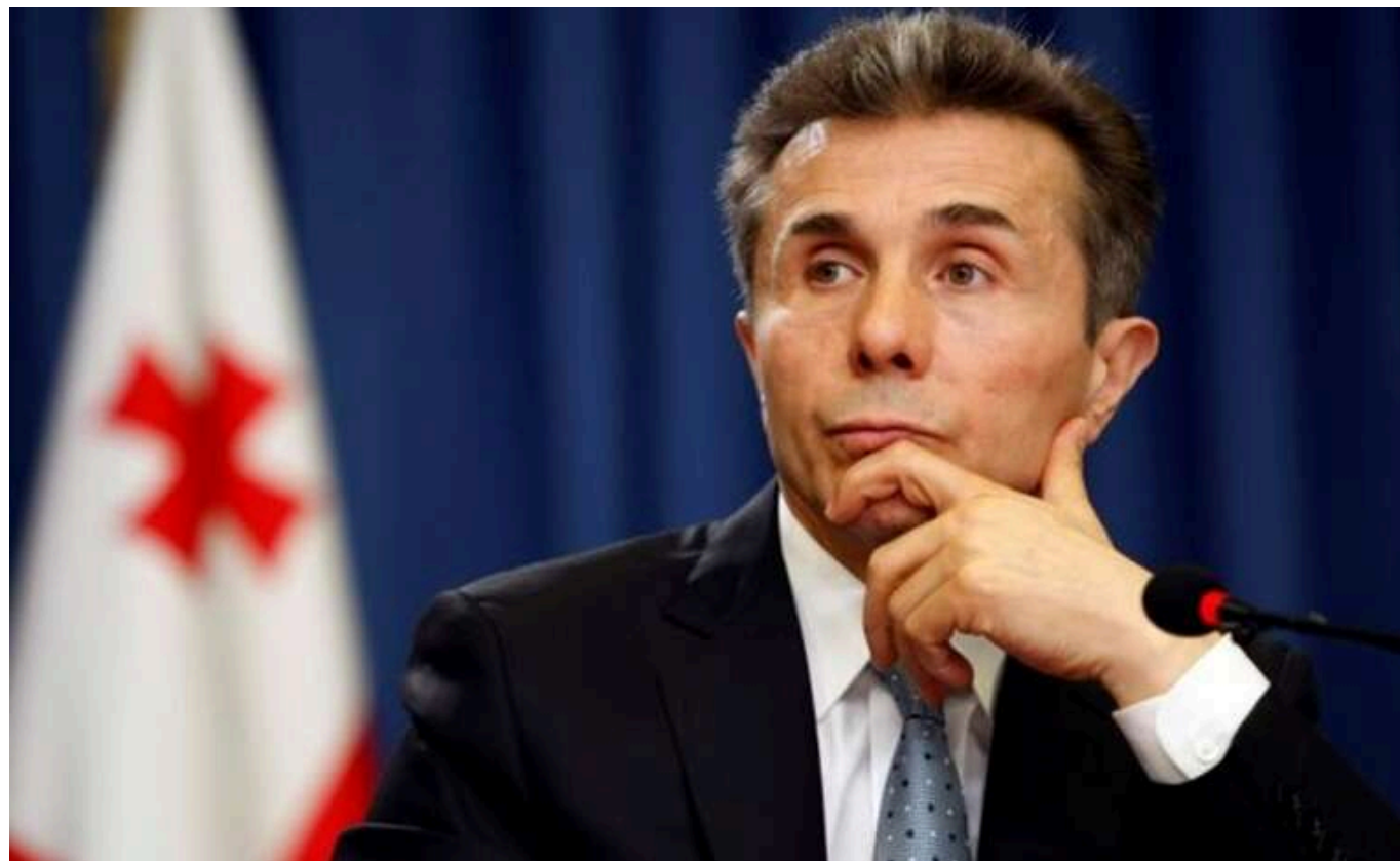
США ввели санкції проти засновника правлячої в Грузії партії "Грузинська мрія"

Сполучені Штати Америки запровадили фінансові санкції проти засновника і почесного голови правлячої партії "Грузинська мрія" в Грузії, експрем'єра країни, мільярдера Бідиани Іванішвілі.