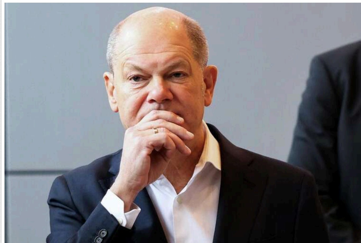
Шольц: Путін зазнав поразки в Україні по всіх пунктах

Російський диктатор Володимир Путін зазнав поразки в Україні та не досяг своїх цілей. Його намагання послабити НАТО закінчилися невдачею.