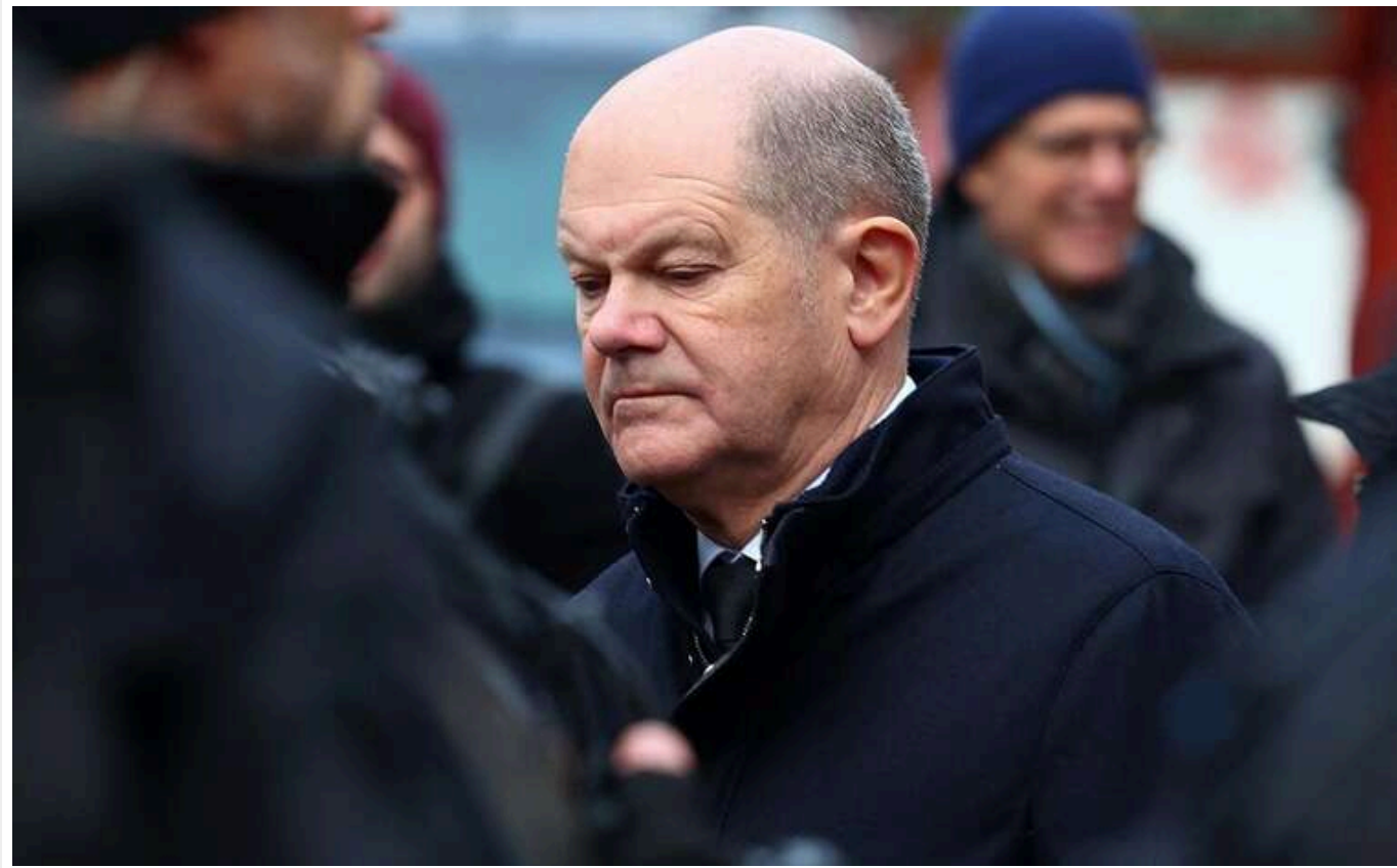
Шольц: Німеччина відіграватиме важливу роль у гарантіях безпеки для України

Союзники України постійно обговорюють, яким може бути шлях до миру. Також розглядаються гарантії безпеки для України.