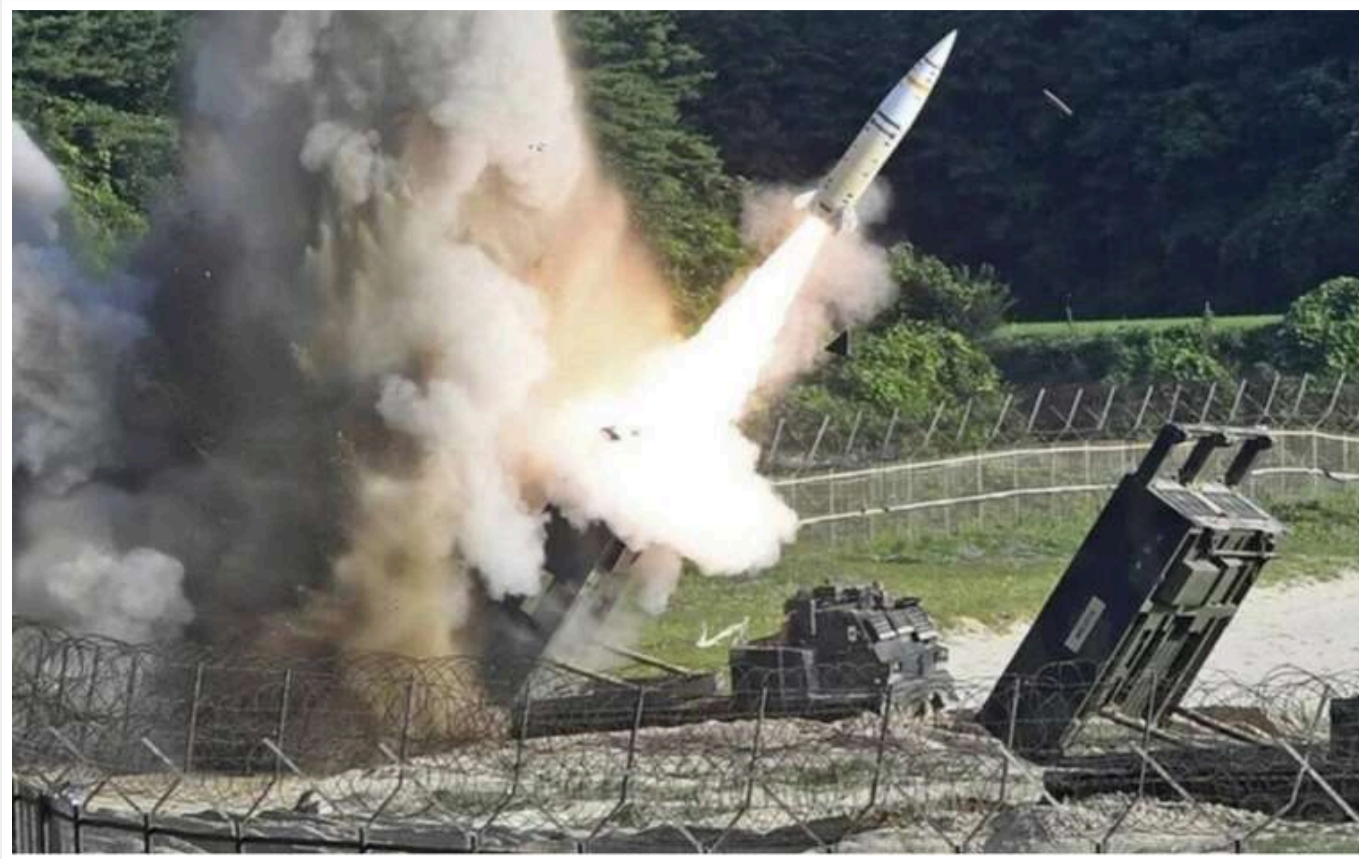
В Україні закінчуються західні далекобійні ракети, - NYT

Запаси західних далекобійних ракет в Україні підходять до кінця, через що вона все рідше завдає ударів по території РФ, повідомляє The New York Times.