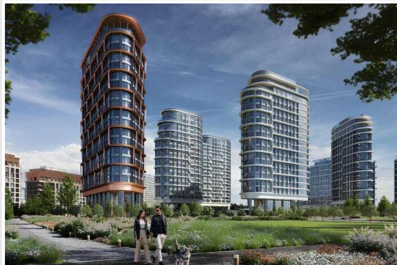
Пушилін рекламує новий ЖК в окупованому Донецьку: вартість значно перевищить 120 тисяч за квадратний метр

Ціна житла в новому житловому комплексі, що рекламується Пушиліним, у центрі окупованого Донецька значно перевищить 120 тисяч рублів за квадратний метр.