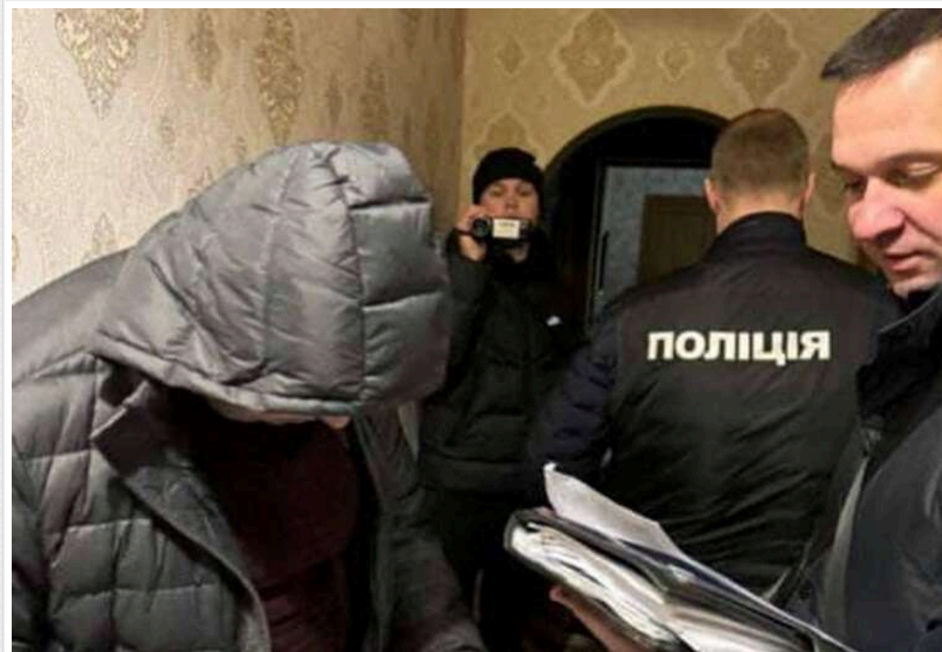
В Харківській області провели 39 обшуків у співробітників ТЦК та ВЛК

У Харківській області правоохоронці викрили корупційну схему, в якій були залучені співробітники РТЦК та ВЛК. У рамках слідства проведено 39 обшуків у осіб, причетних до справи.