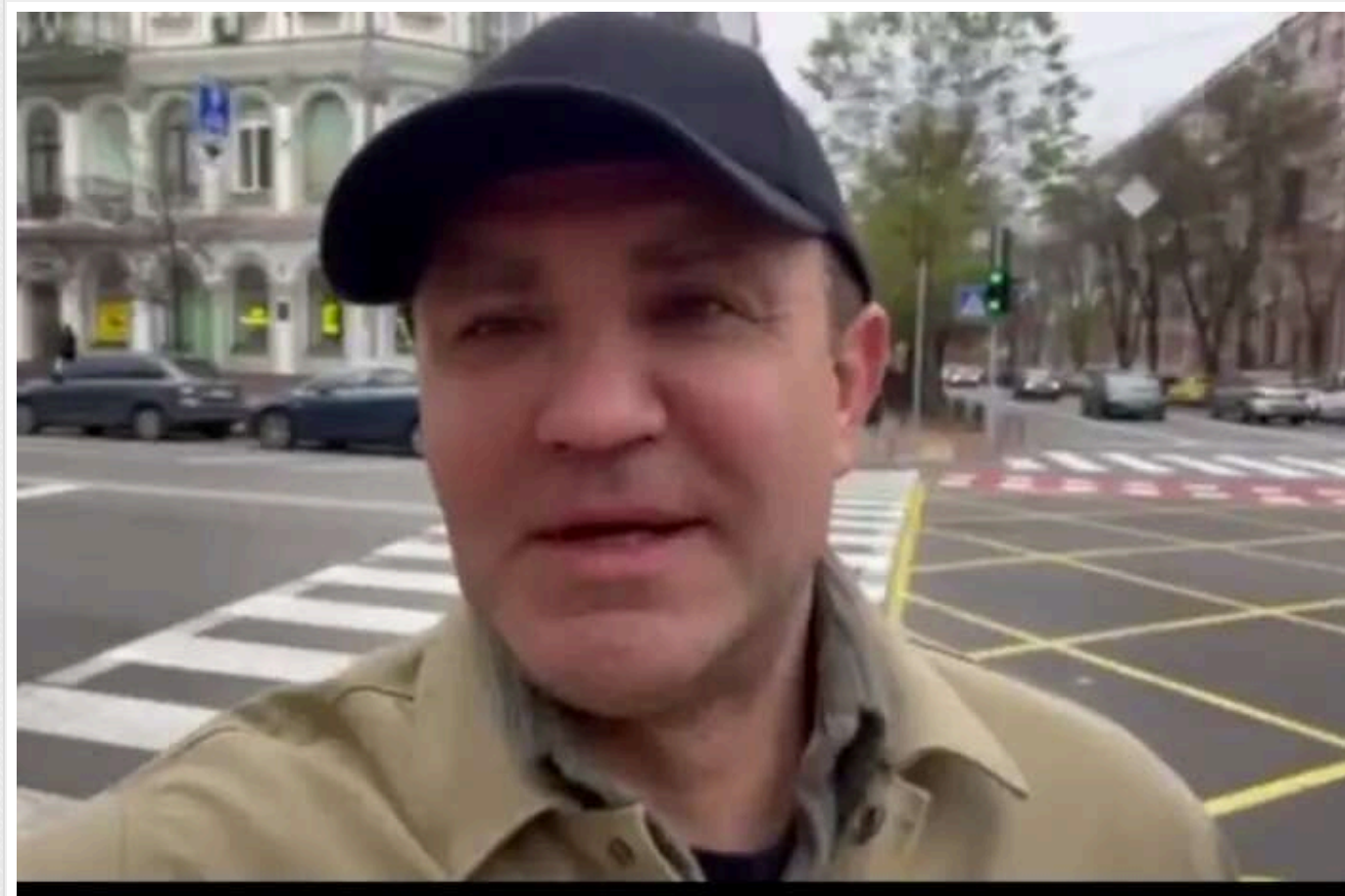
У Тищенка знайшли 500 тисяч доларів і 400 тисяч євро незадекларованої готівки

Народного депутата Верховної Ради від «Слуги народу» Микола Тищенка перевіряють через те, що вартість майна, яким він фактично користується, значно перевищує його законні доходи.