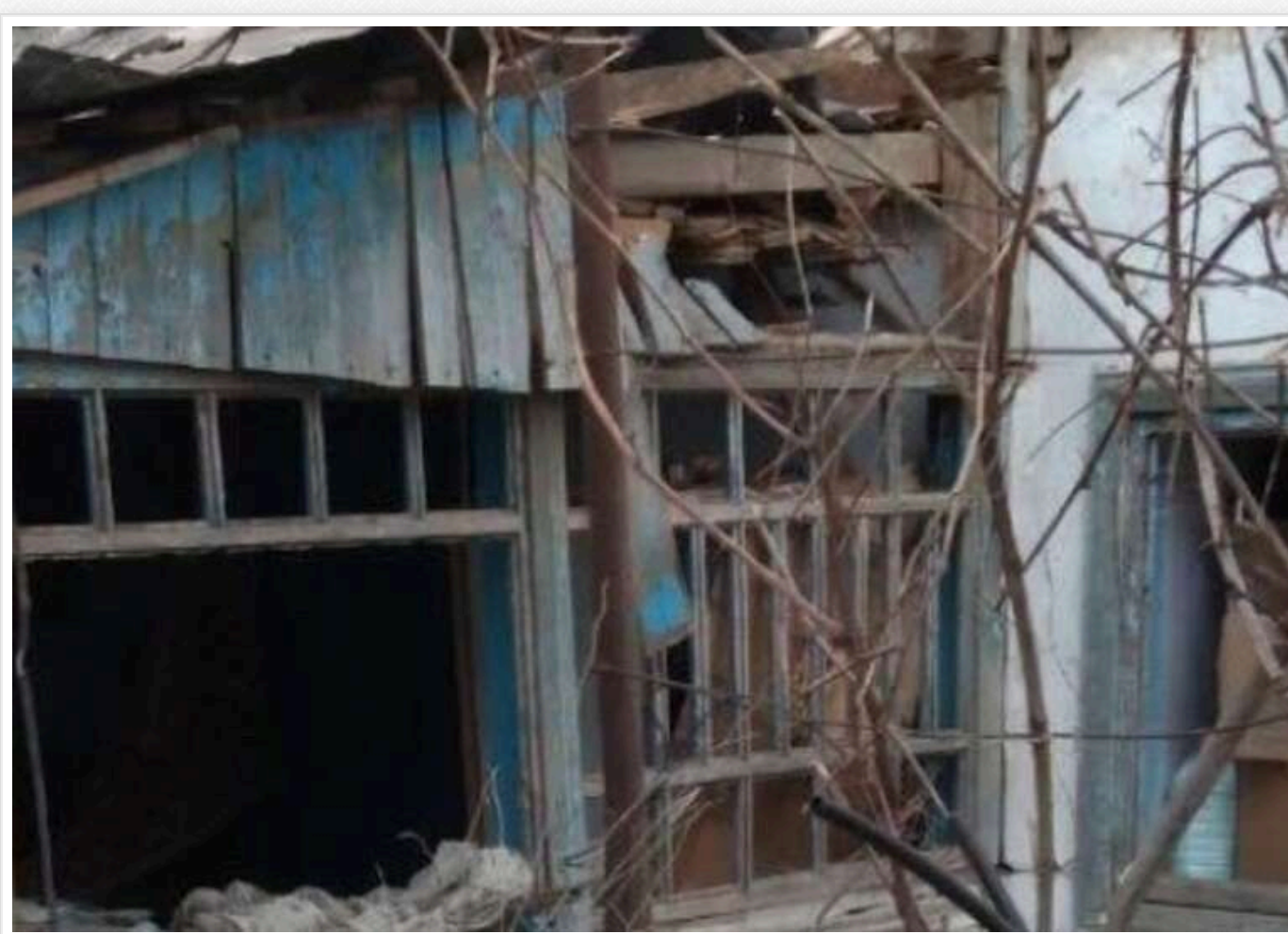
Російські окупанти на Херсонщині тричі скинули вибухівку з дрона на один і той самий будинок

У Херсонській області росіяни з БПЛА тричі атакували будинок у селі Саблуківка, жертв немає.