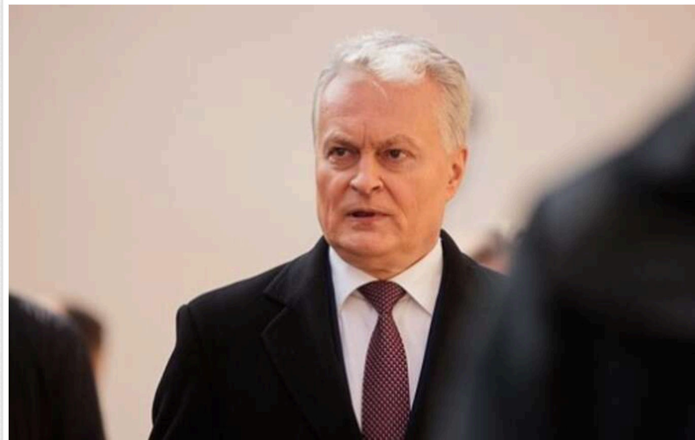
Литві слід виділити 5,5% ВВП на оборону, щоб сформувати армійську дивізію до 2030 року, - Науседа

Президент Литви Гітанас Науседа вважає, що якщо ставити за мету створення армійської дивізії до 2030 року, то на оборону слід виділяти 5,5% валового внутрішнього продукту.