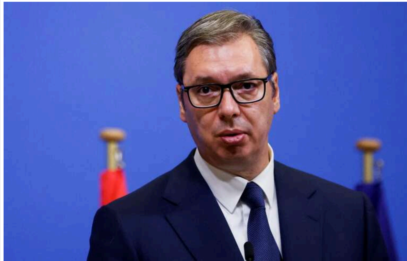
Президент Сербії прогнозує відновлення роботи Північного потоку через рік

Президент Сербії Олександр Вучич висловив упевненість, що Німеччина впродовж року знову почне купувати російський газ через "Північний потік".