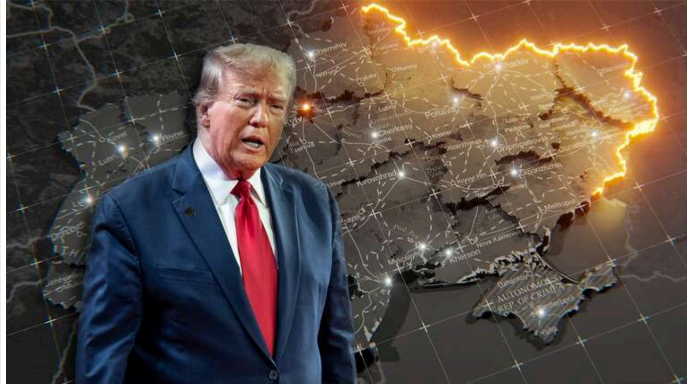
Українці розділилися у думках щодо Трампа, чи наблизить його перемога мир

Майже половина українців (45%) вважають, що перемога Дональда Трампа на виборах у США може наблизити мир у війні з Росією, хоча лише 15% впевнені, що це станеться значною мірою.