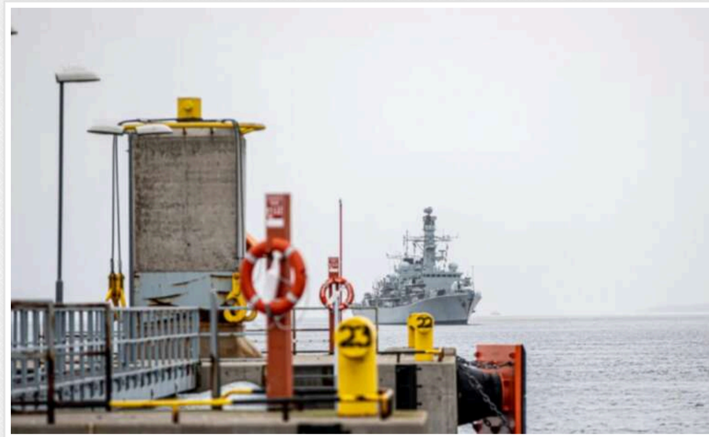
Через інциденти з кабелями НАТО збільшить присутність у Балтійському морі

Генеральний секретар НАТО Марк Рютте заявив, що Альянс збільшить свою присутність у Балтійському морі через інциденти з пошкодженням підводних кабелів.