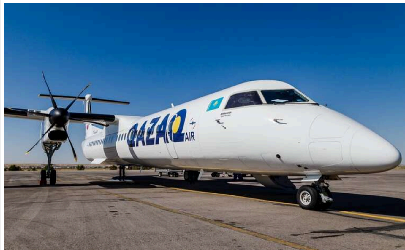
Казахстанська авіакомпанія Qazaq Air тимчасово припиняє рейси до Росії на одному з маршрутів

Авіакомпанія Казахстану Qazaq Air оголосила про тимчасове призупинення польотів до Росії за маршрутом Астана – Єкатеринбург до 27 січня наступного року.