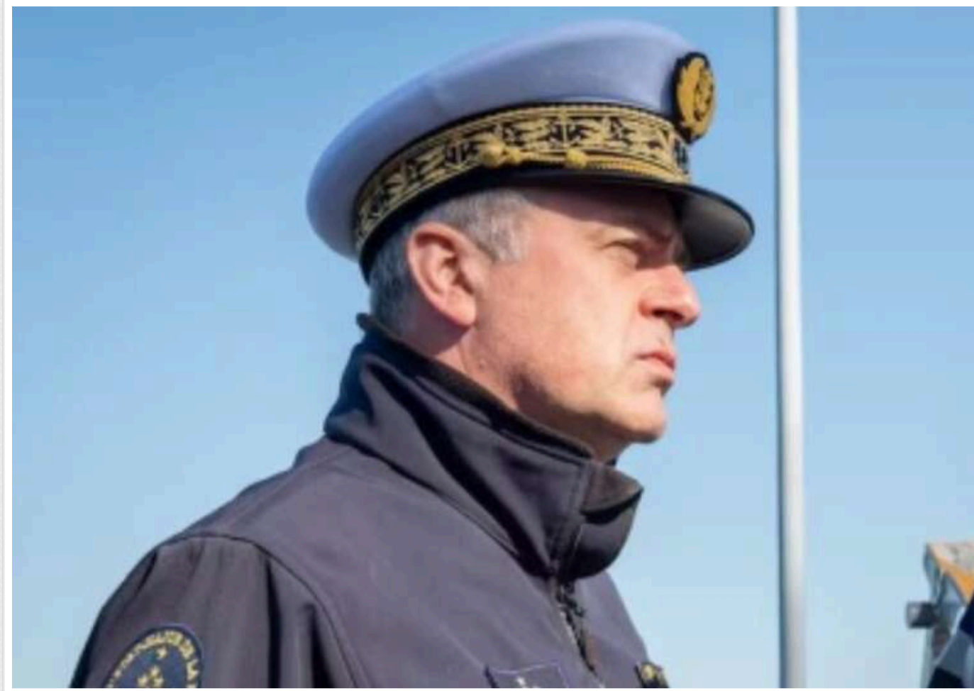
Адмірал НАТО поділився своїми думками щодо того, як Альянс має протидіяти російському «Орешнику»

Якщо в Росії є можливості для завдання ударів по території Європи на відстань 2 000 км, то Північноатлантичному Альянсу слід мати засоби для відповіді.