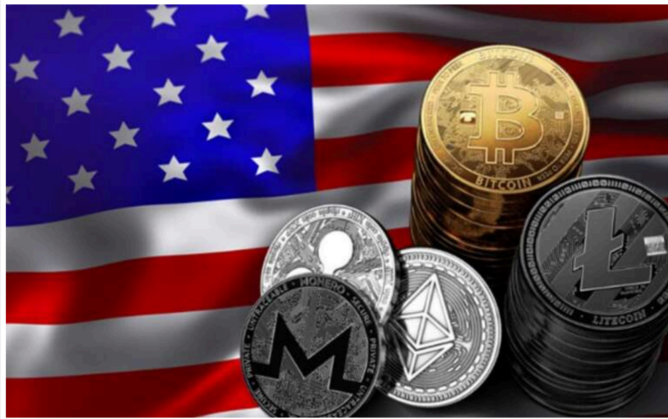
FT: Компанії, що займаються криптовалютами, обиратимуть США замість ЄС завдяки прихильній політиці Трампа

Сприйняття Дональдом Трампом криптовалют може поставити під загрозу нові європейські правила щодо цифрових активів, оскільки компанії надають перевагу більш дружньому ринку США, залишаючи Європу на узбіччі, попереджають представники галузі.