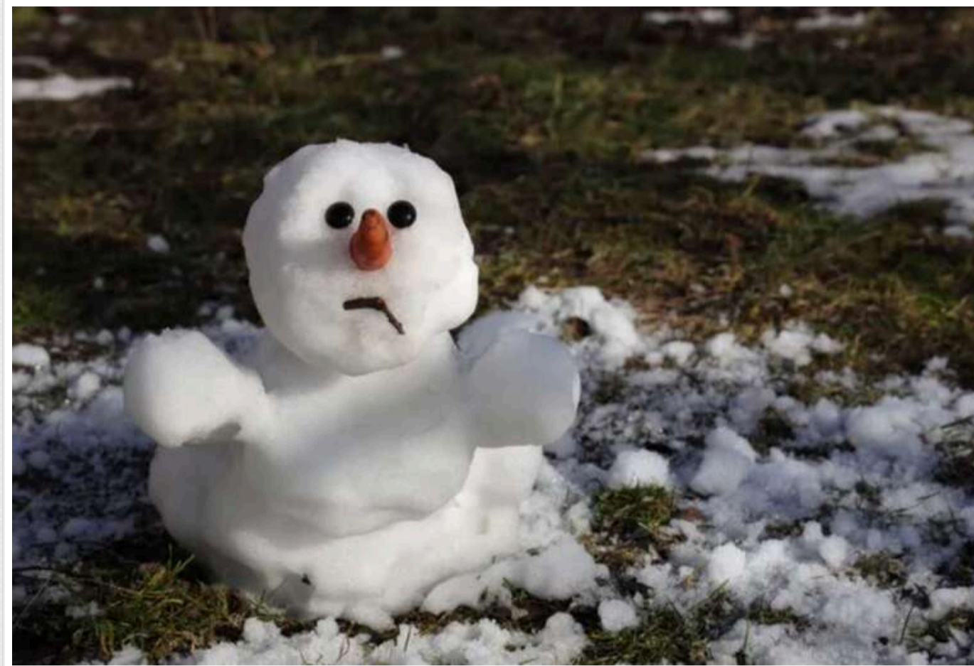
Синоптикиня дала прогноз на Новий рік: сніг випаде лише в деяких регіонах

Вихідні, 28-29 грудня, в Україні пройдуть під впливом антициклону. Щодо Нового року, то сніг ймовірний лише в деяких регіонах.