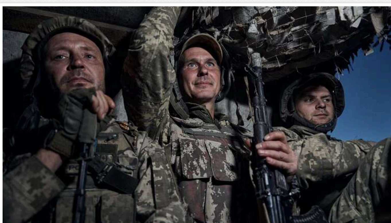
ISW: Окупанти, ймовірно, захопили місто Курахове в Донецькій області

Ймовірно, російські війська захопили місто Курахове в Донецькій області. Проте їм може бути важко просуватися далі на захід від цього населеного пункту.