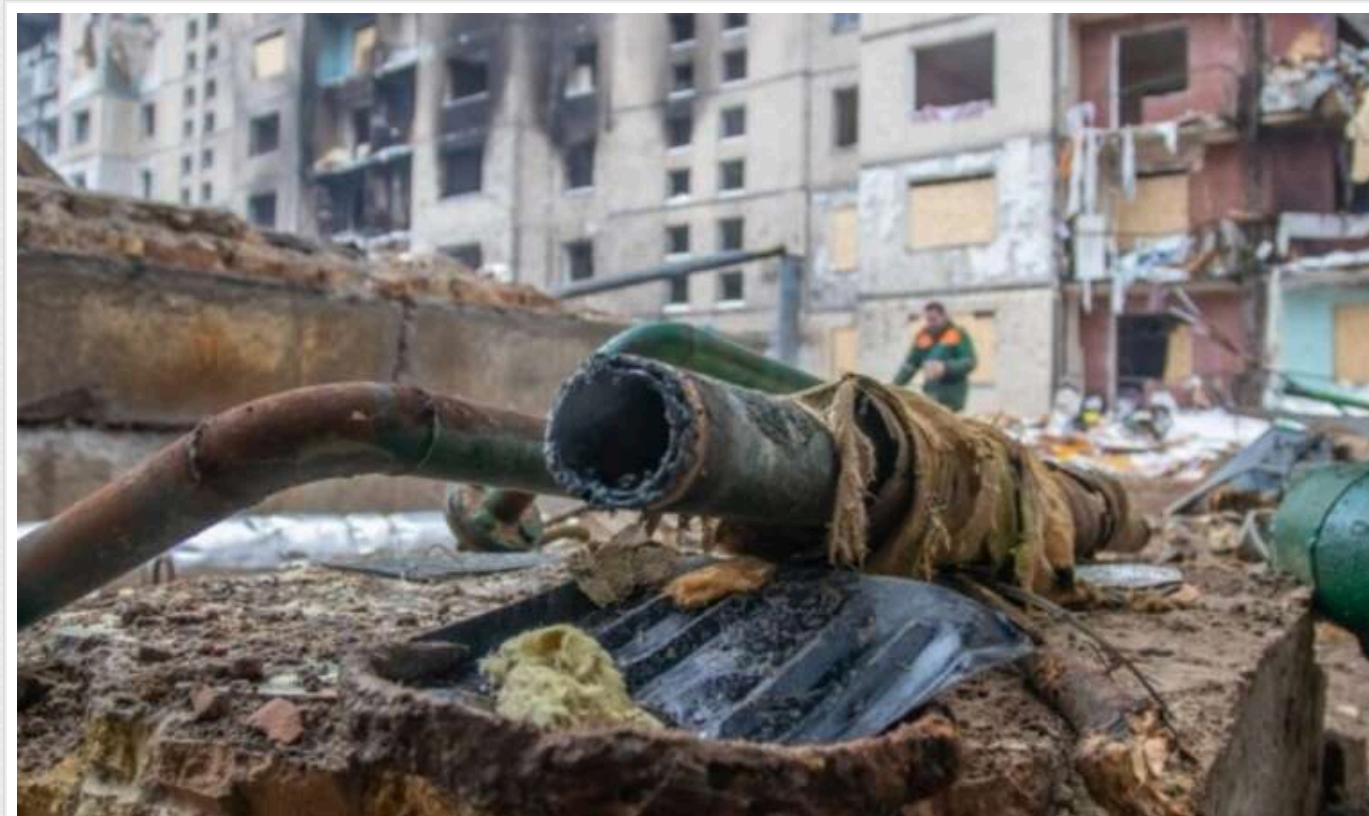
Ворог атакував селище Слатине на Харківщині

Приблизно о 14:15 26 грудня два російські КАБи атакували село Слатине, внаслідок чого загинув співробітник аграрного підприємства та ще дві людини отримали поранення.