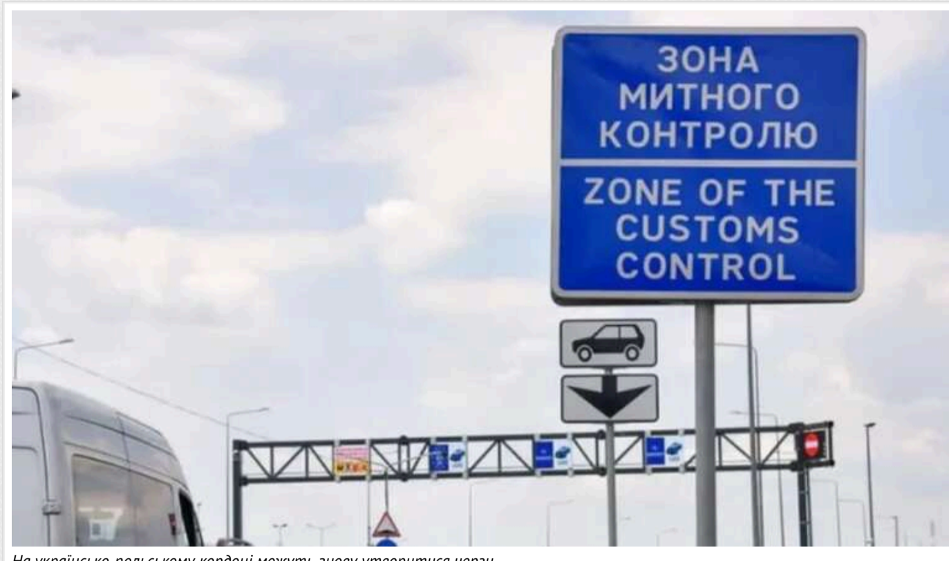
На українсько-польському кордоні можуть знову утворитися черги

На цей час черги на українсько-польському кордоні відсутні, проте ближче до Нового року (29-31 грудня) пасажиропотік може значно зрости. Щоб уникнути затримок, рекомендується планувати поїздки заздалегідь та стежити за оновленнями.