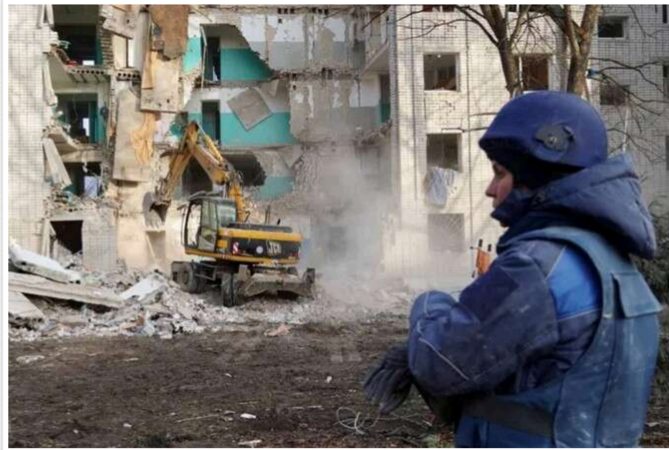
Окупанти здійснили масований обстріл прикордонних територій Сумщини

У четвер, 26 грудня, російські війська влаштували масований обстріл прикордонних територій Сумщини.