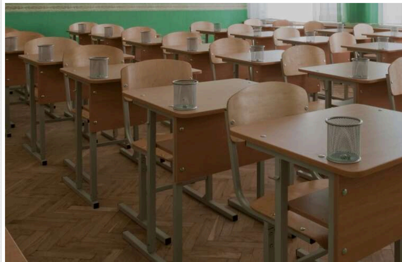
У Львові вчитель облаяв учнів і побажав їм смерті на фронті

У Львові вчитель фізики загальноосвітньої школи №30 під час уроку звернувся до учнів із неприпустимими висловлюваннями, заявивши: «Треба на фронт вас, може там здохнете швидше».