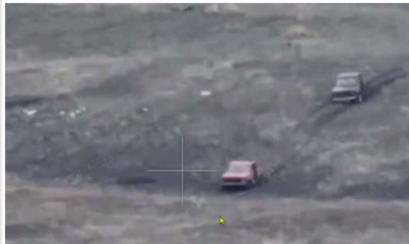
Окупанти атакували позиції ЗСУ на рожевих "Жигулях"

Російські військові нещодавно спробували атакувати позиції ЗСУ на радянських "Жигулях". Ймовірно, це пов'язано з браком техніки.