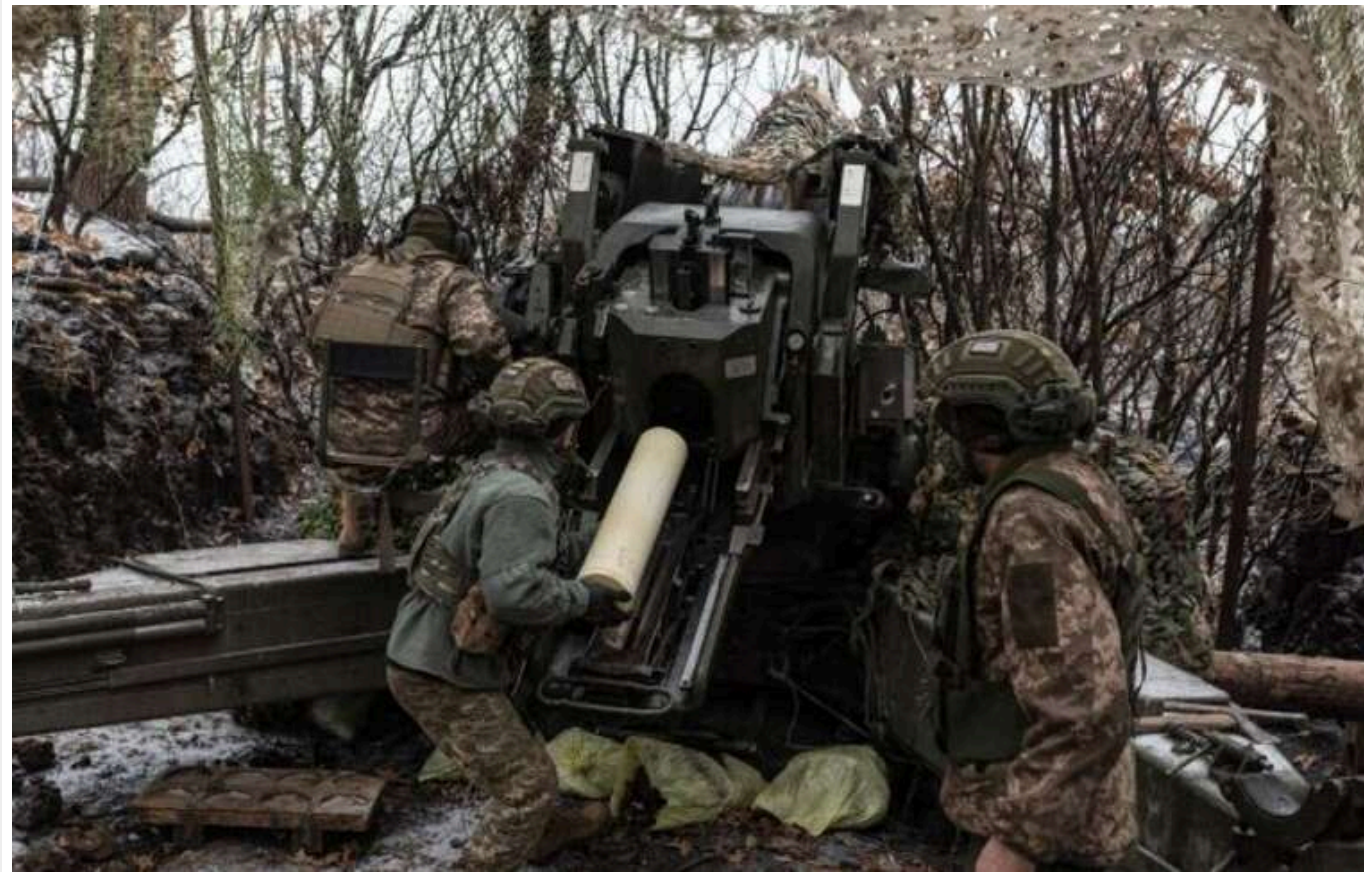
Загарбники підвищили на третину інтенсивність артобстрілів на півдні України, - ЗСУ

Російські окупанти минулої доби на півдні України збільшили число артилерійських обстрілів на третину. Тим часом на Времівському напрямку ворог здійснює менше штурмів.