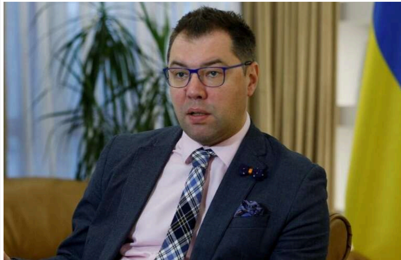
Зеленський ухвалив рішення замінити посла України в Німеччині – ЗМІ

Президент Володимир Зеленський вирішив звільнити українського посла в Німеччині Олексія Макеєва. Замість нього диппредставництво очолить теперішній посол в Ізраїлі.