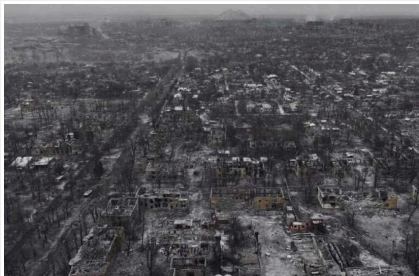
Росіяни змінили тактику в районі Торецька та Часового Яру, - ОТУ "Луганськ"

Ситуація в Торецьку вкрай важка, йдуть бої з російськими військами за кожну будівлю.