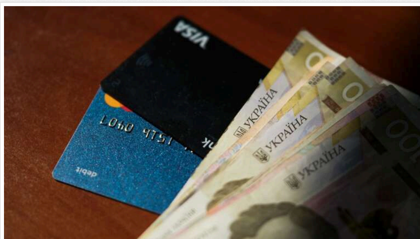
Українці сплачуватимуть військовий збір 5% із зарплати, а для ФОП I, II та IV груп військовий збір становитиме 800 гривень на місяць, - Мінфін

Мінфін опублікував інфографіку про те, як підвищуються податки.