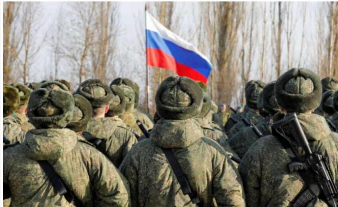
«Бої відрізняються крайньою жорсткістю»: у ЗСУ розповіли про спроби російських військ прорватися в Покровськ

Російська армія прагне оточити Покровськ у Донецькій області, намагаючись прорватися до міста через обидва фланги.