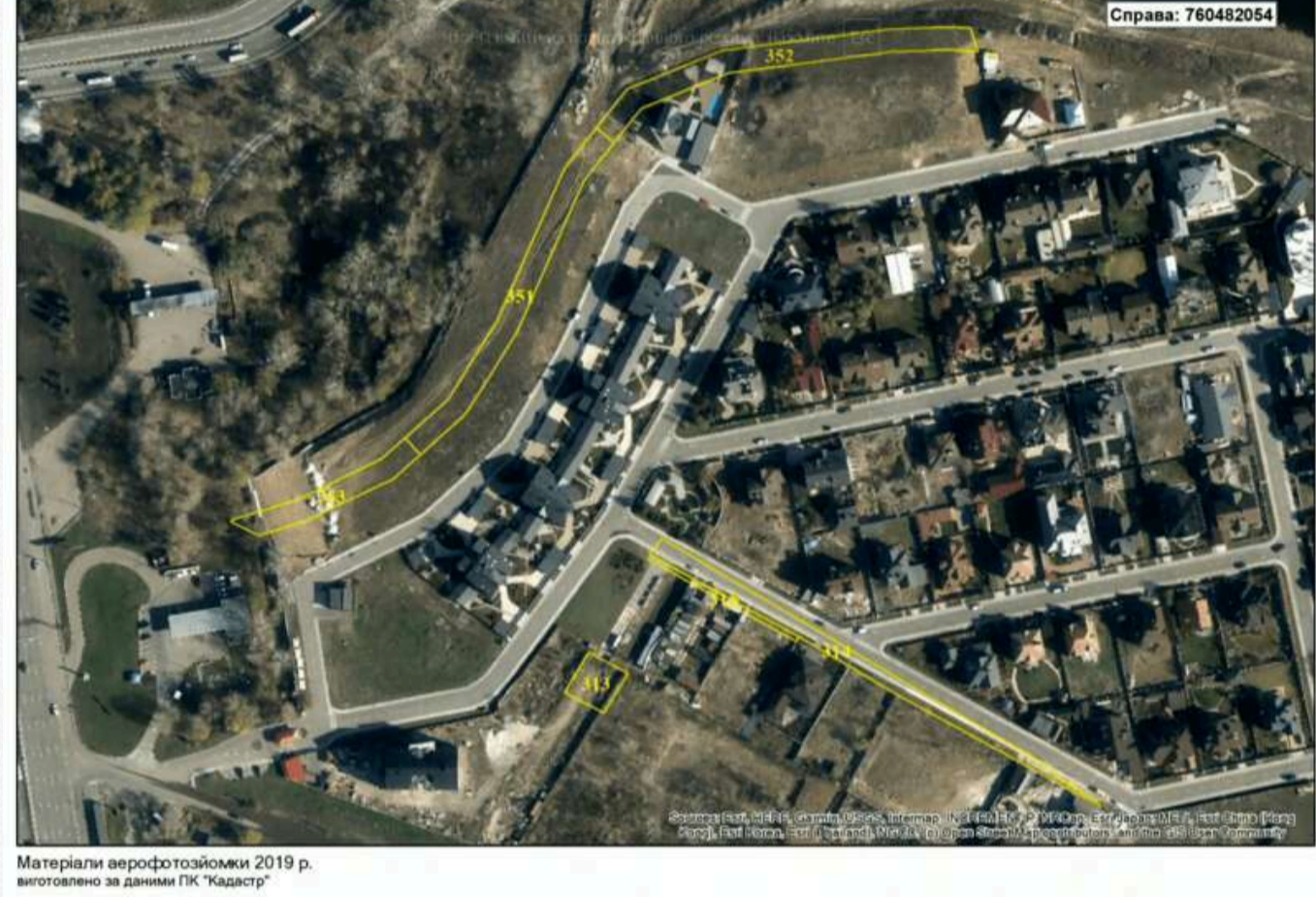
Міністерство територіального розвитку України

Йдеться про земельні ділянки загальною площею 0,6016 га. Три з них – площею 0,0398 га, 0,13013 га і 0,0154 га – мають цільове призначення “для будівництва та обслуговування житлових будинків, господарських будівель і споруд”. Інші три ділянки – площею 0,1614 га, 0,1722 га і 0,0825 га – призначені “для будівництва та обслуговування об’єктів інженерної транспортної інфраструктури (крім об’єктів дорожнього сервісу)”. Договір оренди цих ділянок між міськрадою і ОК “ЖБК “Коник” було укладено 25 грудня 2015 року, а завершився термін користування ще у грудні 2020 року. Відповідно, згідно з рішенням, прийнятим у грудні 2024-го, термін оренди поновлено ще на 5 років.