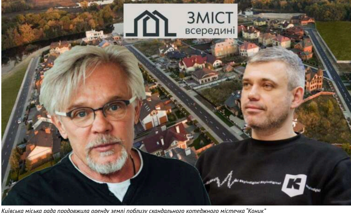
Київська міська рада продовжила оренду землі поблизу скандального котеджного містечка “Коник”