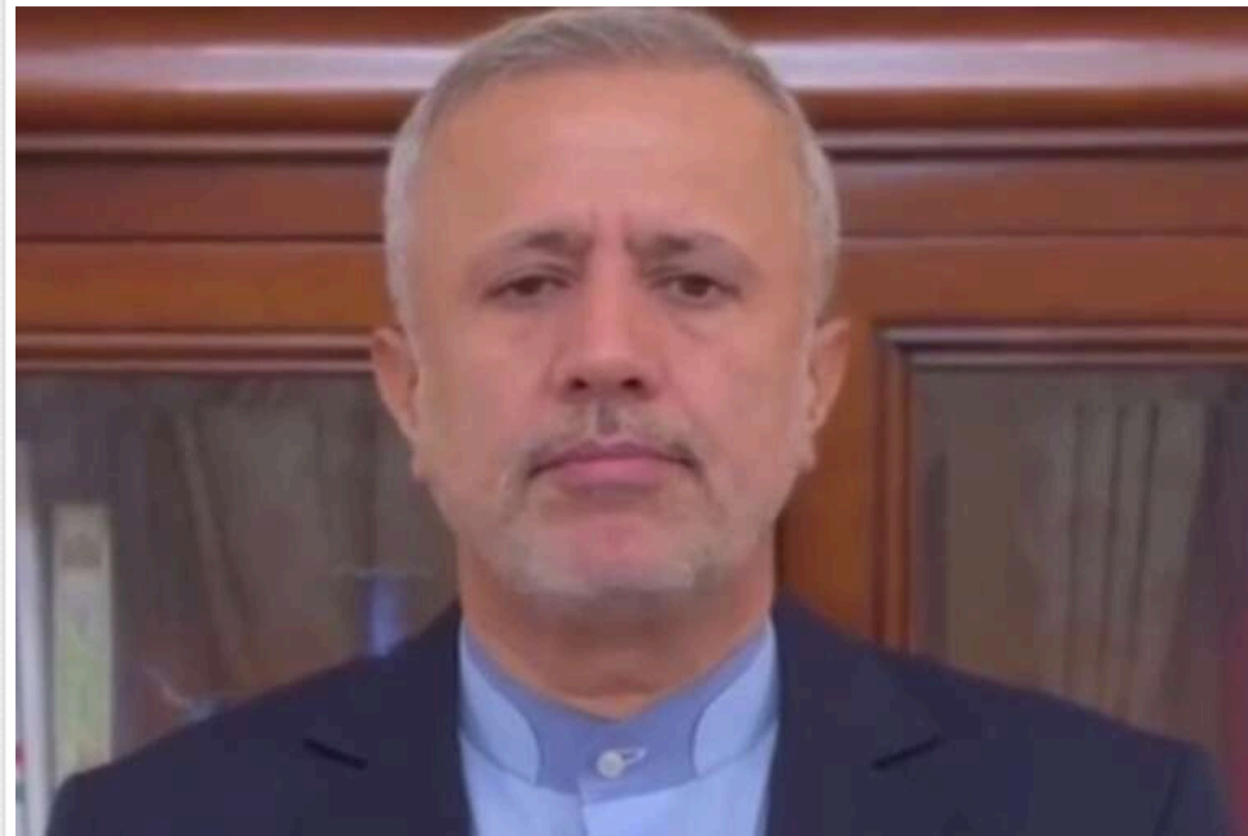
Іран привітав Україну з Різдвом і побажав миру в Новому році