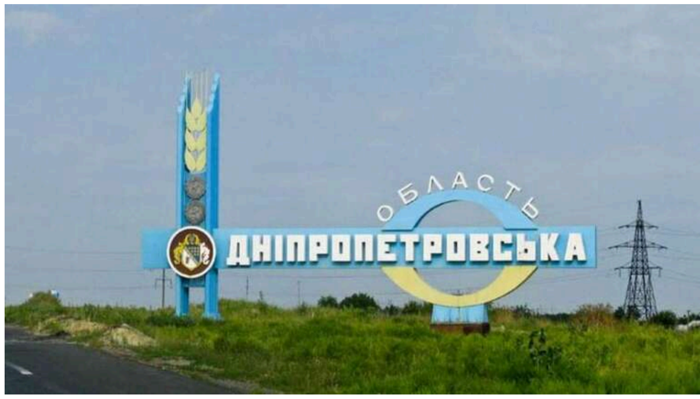
Окупантам до адмінмежі Дніпропетровської області залишилися 7 кілометрів, – військовий