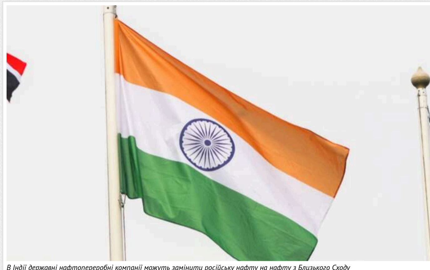
В Індії державні нафтопереробні компанії можуть замінити російську нафту на нафту з Близького Сходу

Індійські державні компанії з нафтопереробки розглядають можливість закупівлі сирової нафти на спотовому ринку Близького Сходу у зв'язку зі зменшення поставок від їхнього основного постачальника – Росії.