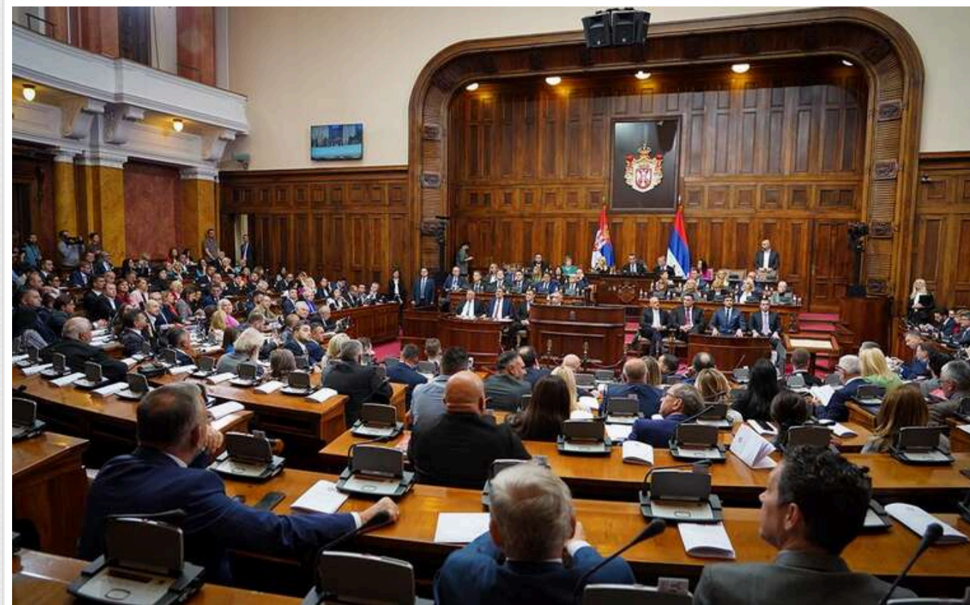
Парламент Сербської Республіки дозволив Додіку не реагувати на виклики суду БІГ

Парламент Республіки Сербської – ентитету у складі Боснії та Герцеговини – дозволив президенту РС Мілораду Додіку ігнорувати виклики до суду БІГ через хворобу і закликав представників РС в інституціях БІГ бойкотувати їхню роботу у зв'язку зі справою проти Додіка; ключові держави Заходу заявили, що такі кроки не відповідають законодавству БІГ.