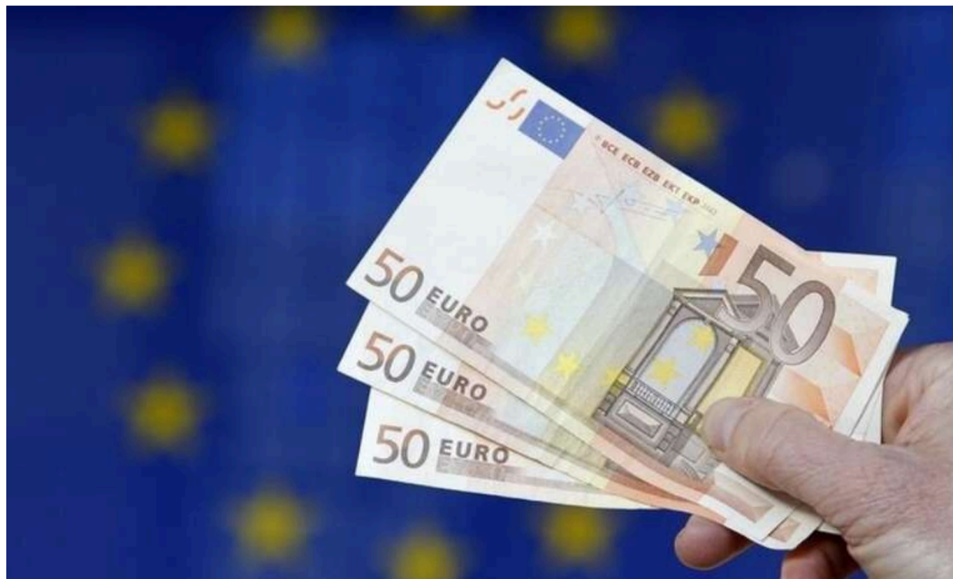
Україна отримала 150 мільйонів євро у вигляді грантових коштів від Євросоюзу

Європейський Союз перерахував Україні другий транш грантової допомоги на суму 150 мільйонів євро для швидкої відбудови.