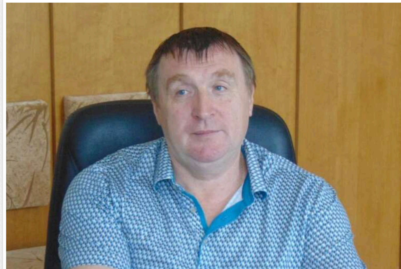
Справу проти гендиректора «Павлоградського хімічного заводу» не було передано до суду