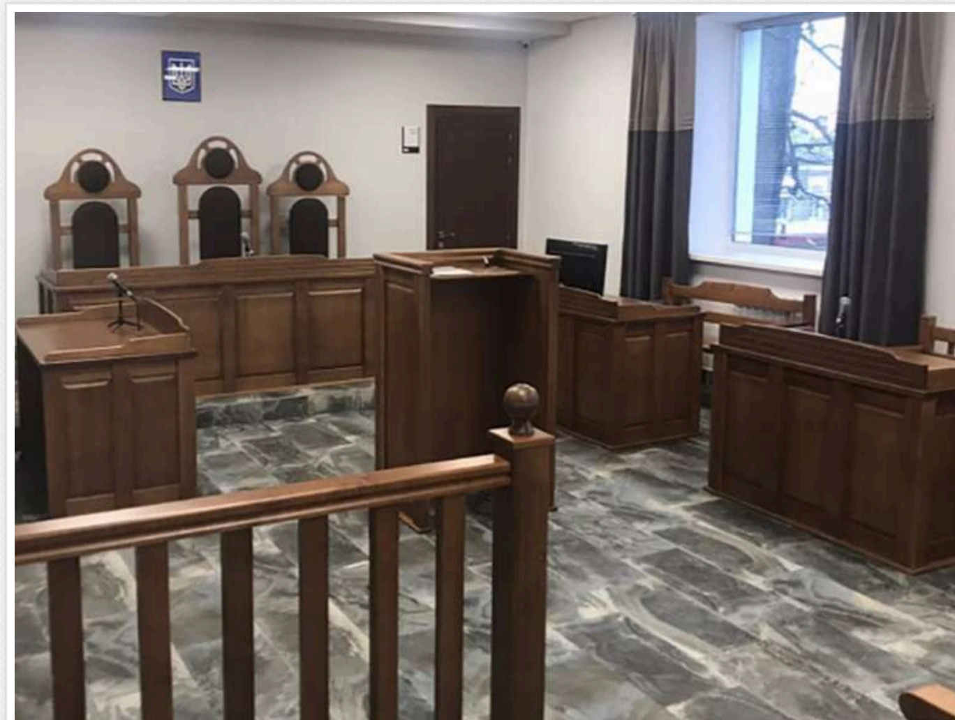
На Одещині чоловік отримав 3,5 років позбавлення волі за відмову від мобілізації: "Є сином Бога"

В Одеській області суд засудив чоловіка до 3,5 років позбавлення волі за відмову від мобілізації, заявивши, що "вважає себе нейтральним стосовно держави, не ідентифікує себе з українським народом, а є сином бога".