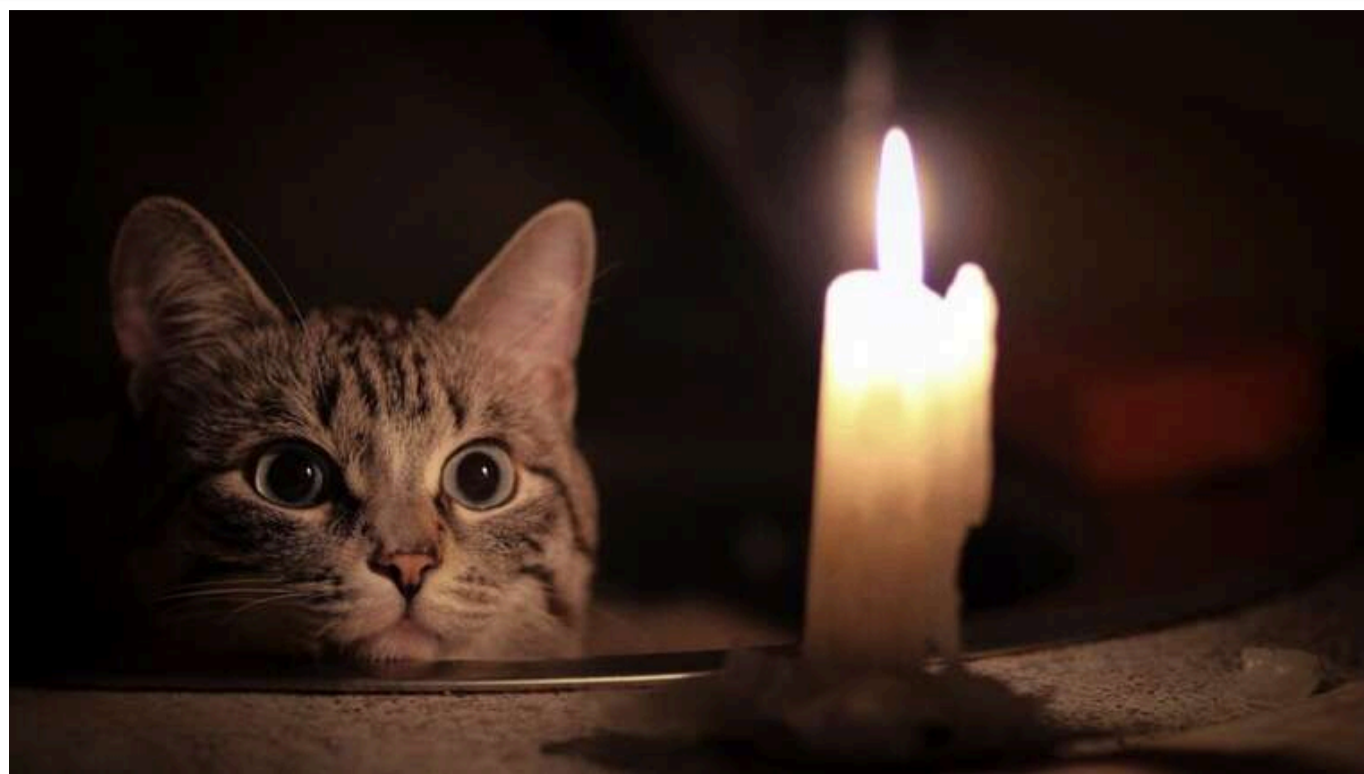
Відключення світла в Україні: в «Укренерго» оновили графіки

Вимкнення електроенергії викликані масованою атакою противника.