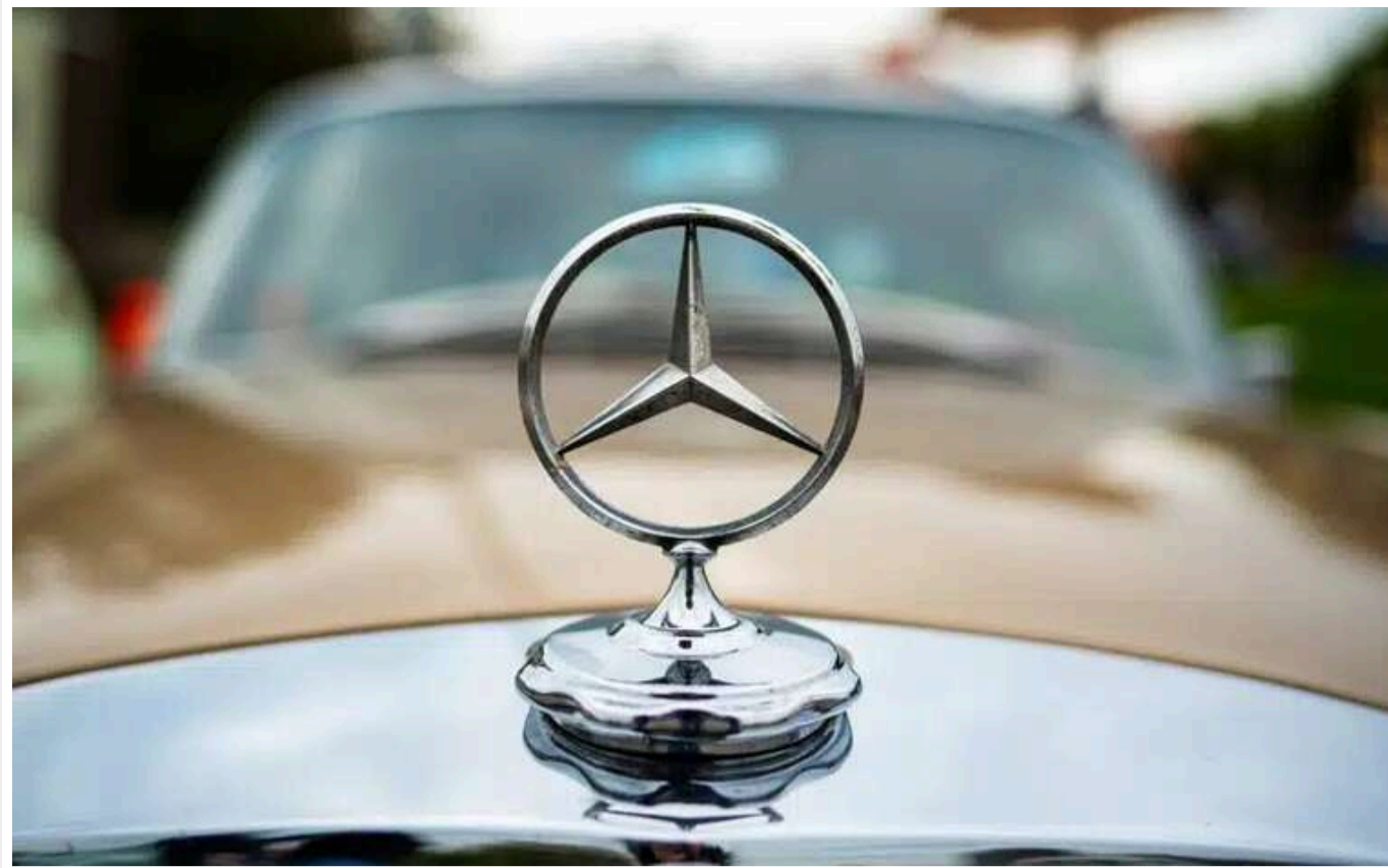
Виробник емблеми «Мерседеса» оголосив про банкрутство

Компанія, що виготовляє емблеми Mercedes-Benz, оголосила про банкрутство через кризу в автомобільній промисловості Європи, повідомляє Bloomberg.