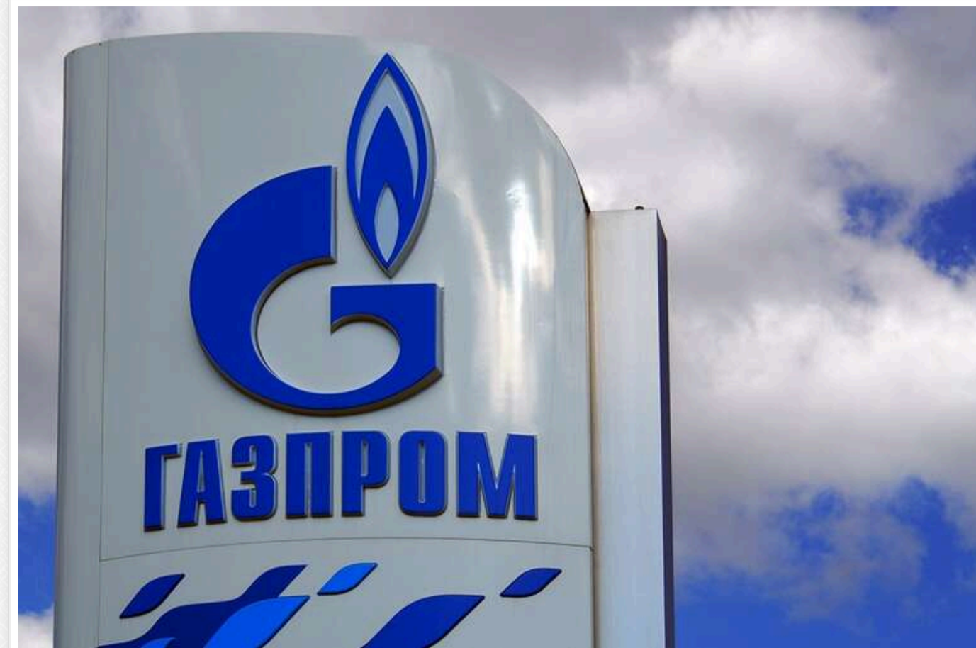
Bloomberg: "Газпром" прогнозує, що доходи від продажу газу цього року перевищать заплановані показники

"Газпром" прогнозує, що доходи від продажу газу цього року перевищать заплановані показники, повідомляє Bloomberg.